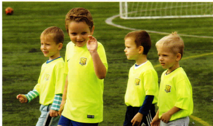
Bozsik tornán az ovis csapatunk

Igyekszünk harmóniát lenni, s úgy nevelni a gyermekeket, hogy a győzni akarás bennünk legyen, de adott esetben elégedjünk meg a tisztességes helytállással is.